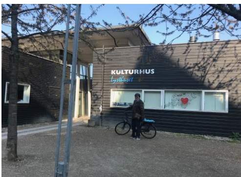
Her ventes der på jer.

Vi mødes kl. 10:00 ved Kulturhuset på Islands Brygge (Islands Brygge 18, 2300 København S) ved den bygning, som bærer navnet "Lysthuset".