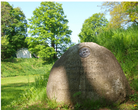
Mindesten i Mindelunden

Vi cykler ad Århusgade og Jagtvej til Vibehus Runddel (metro) her kan dem der kommer fra Nørrebro og Frederiksberg støde til, vi er der ca. kl. 12.15.