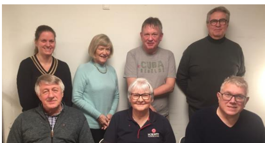
Foto af nuværende bestyrelse.