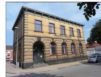
DE FRIVILLIGES HUS DANMARKSGADE 12 — FREDERIKSHAVN